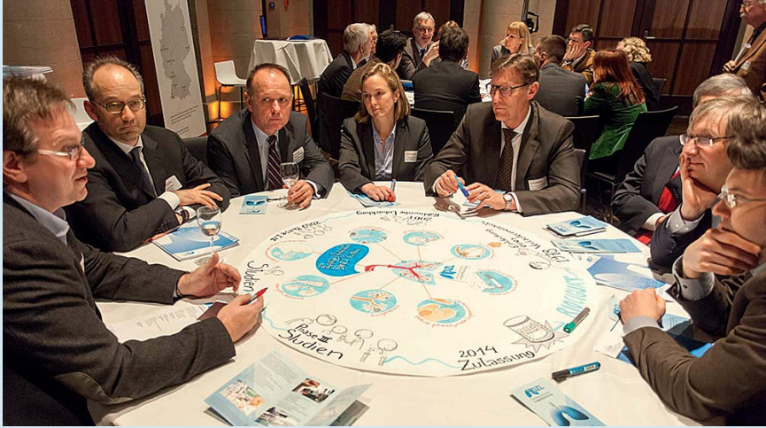
Parlamentarischer Abend in Berlin, DZL-Tisch.

kussion zwischen den DZG-Sprechern. Die Besucher hatten anschließend die Möglichkeit, in Tischrunden mit Wissenschaftlern ins Gespräch zu kommen und mehr über die einzelnen Zentren und ihre Projekte zu erfahren. Am Tisch „Every breath you take“ erläuterten DZL-Wissenschaftler konkrete Beispiele aus der translationalen Lungenforschung, wie u. a. den Entwicklungsprozess des PH-Medikamentes Riociguat.